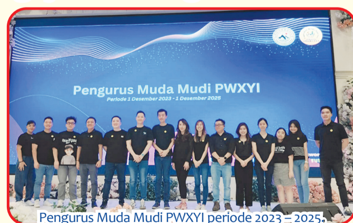
Pengurus Muda Mudi PWXYI periode 2023 - 2025.