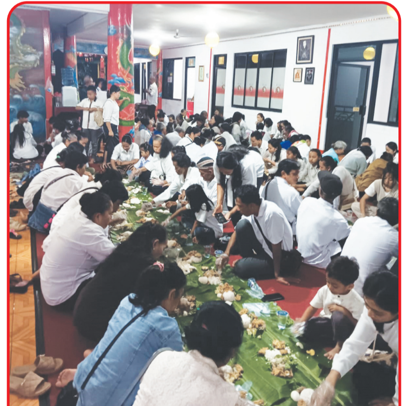
Ratusan umat Buddha antusias menikmati hidangan brokohan (hidangan vegetarian yang disajikan dengan daun pisang).

"Harapannya agar ke depan bangsa Indonesia nantinya bisa lebih makmur, aman dan tentram serta terhindar dari berbagai musibah,"