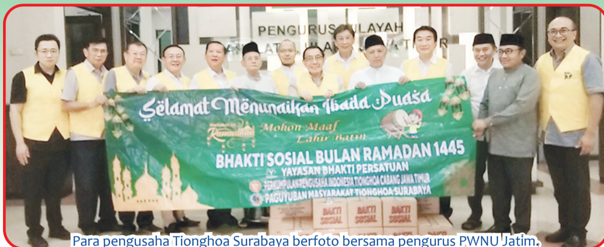
Para pengusaha Tionghoa Surabaya berfoto bersama pengurus PWNU Jatim.

SURABAYA (IM) - Pengusaha Tionghoa Surabaya yang tergabung dalam YBP (Yayasan Bakti Persatuan), PERPIT (Perkumpulan Pengusaha Indonesia Tionghoa) Jatim dan PMTS (Paguyuban Masyarakat Tionghoa Surabaya), kembali menyalurkan bantuan paket sembako. Kali ini, pada Selasa (26/3), sebanyak 1.500 paket sembako diserahkan kepada PWNU Jawa