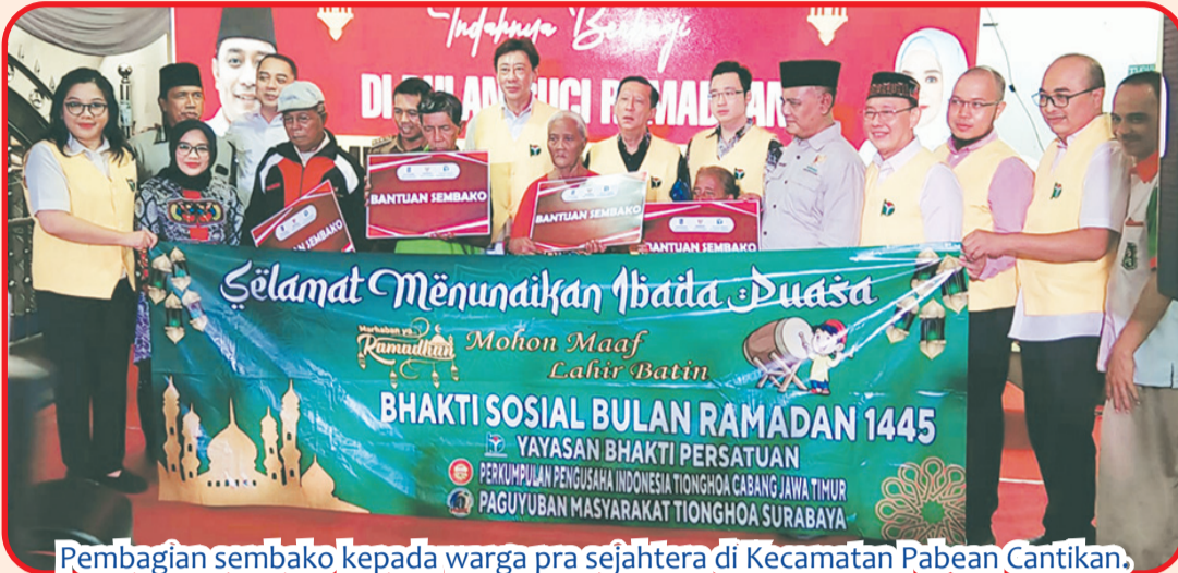
Pembagian sembako kepada warga pra sejahtera di Kecamatan Pabean Cantian.