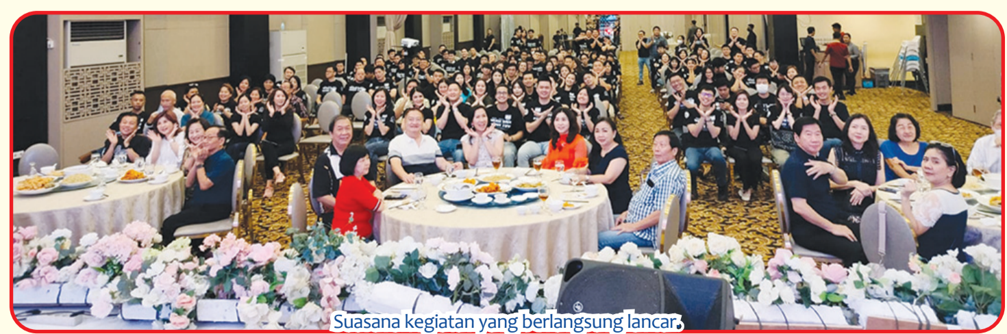
Suasana kegiatan yang berlangsung lancar.