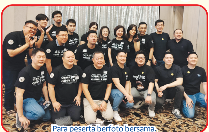
Para peserta berfoto bersama.

luas seluruh dunia. "Sementara misinya adalah melestarikan budaya Xian You, menjalin persaudaraan yang erat sesama suku Xian You khususnya, dan Tionghoa umumnya. Mengembangkan potensi diri generasi muda Xian You, menjadi