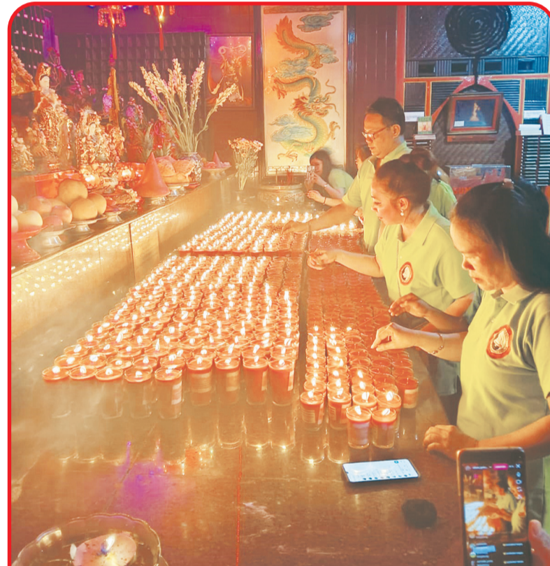
Sejumlah pengurus T.I.T.D Srikukus Redjo - Gunung Kalong Ungaran menyalakan Api Pelita di depan Altar Makco Kwan She Im Poo Sat.

UNGERAN (IM) - Ratusan umat Buddha dari berbagai kota di Jawa Tengah hadir di T.I.T.D Sri Kukus Redjo yang dulu nya lebih dikenal dengan nama Vihara Gunung Kalong yang terletak di Jalan Brigjend Katamso - Susukan Ungaran Timur Kab.Semarang pada Kamis (28/3) malam.