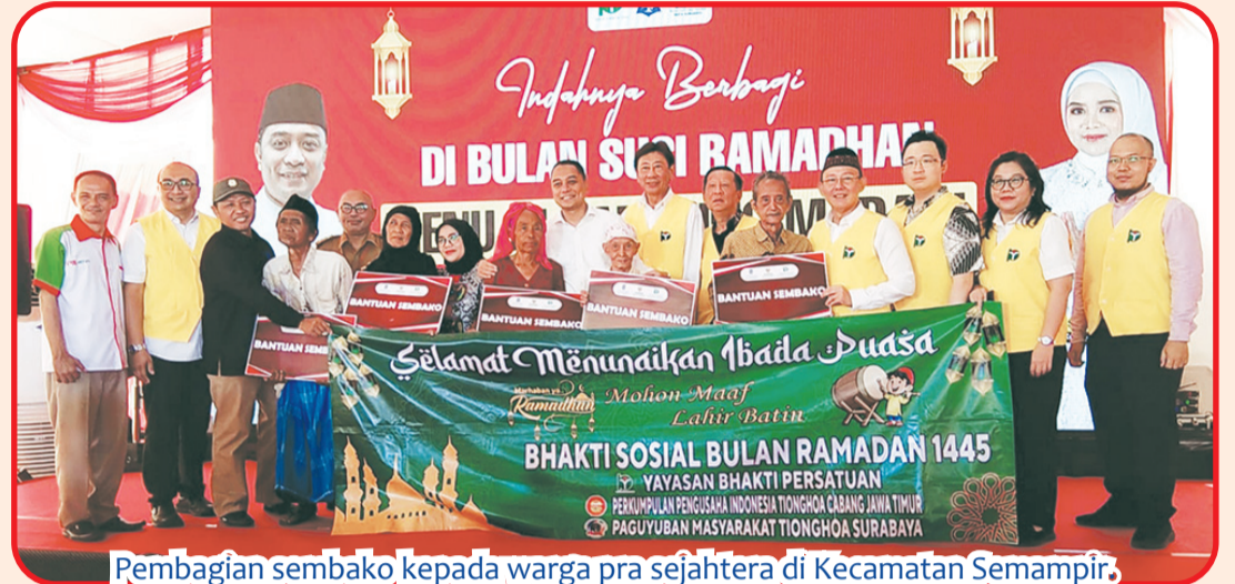
Pembagian sembako kepada warga pra sejahtera di Kecamatan Semampir.

SURABAYA (IM) - Pemkot Surabaya bersama YBP (Yayasan Bakti Persatuan) dan BAZNAS Surabaya, Senin (25/3), membagikan 6.000 paket sembako kepada keluarga miskin, secara serentak di 31 kecamatan.