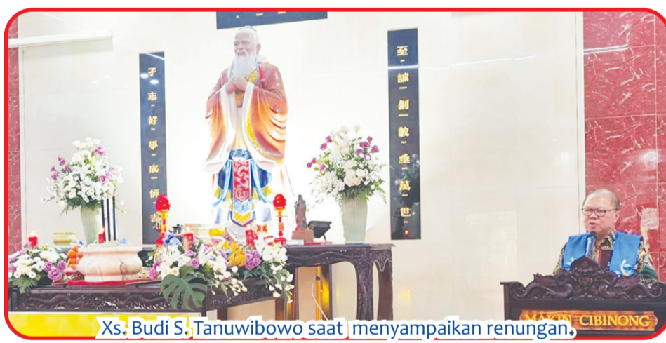
Xs. Budi S. Tanuwibowo saat menyampaikan renungan.

rah, agar tidak melakukan pengulangan yang sama atau hal-hal yang tidak baik. Selanjutnya Xs Budi mengingatkan generasi muda perihal pentingnya secara serius mendalami proses belajar, karena perkembangan zaman yang terus bergerak dengan percepatan yang semakin cepat. Terakhir Xs Budi kembali berpesan kalau ingin beragama dengan baik, yakin bahwa jalan suci Tuhan akan menuntun kita kembali ke watak Sejati, maka hayati ajaran agama secara kritis, mendalam, seimbang, dan diwujudkan dalam tindakan nyata Kebajikan. Yakin Hanya Kebajikan yang berkenan bagi Tuhan. • kris